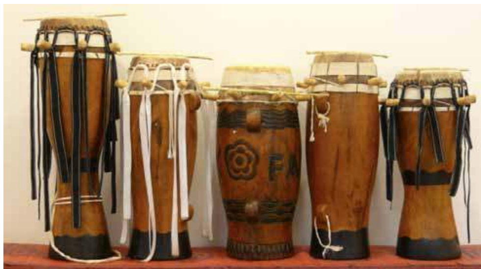
Fig. 2. Ensemble des tambours sabar .

De gauche à droite : ndeer, goronj mbabas, làmb, goronj talmbat et mbëj-mbëj.